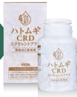
ハトムギCRDエキス含有加工食品